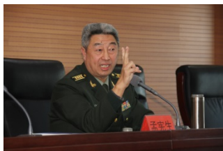
国防大学孟宪生教授应邀作 国际国内形势报告