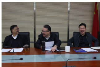
市人社局市场处、市人才服务中心、协会三方合作愉快