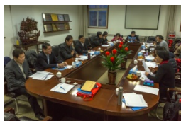
常务理事会议会场