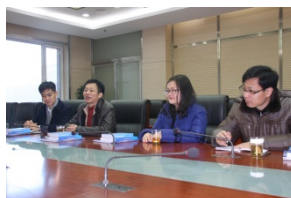
广东佛山同仁与北京方面互动交流