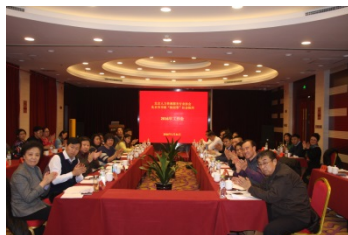
与会代表审议并通过了 “2016 年工作报告”