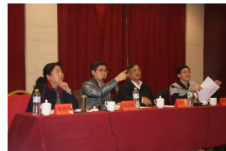
市社工委组织工作处、党建工作处领导 与到会代表互动交流