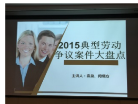
2016年“劳动关系风险防控系列讲座” 1月7日正式开课